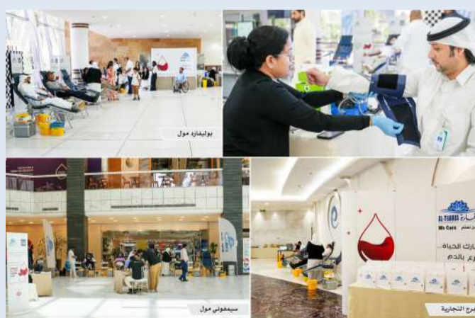
جانب من حملة التبرع بالدم

انطلاقاً من التزامها الراسخ بالمسؤولية الاجتماعية، وحرصها على ترسيخ مبادئ الاستدامة، وتعزيز ثقافة العطاء والعمل التطوعي، نظمت الشركة التجارية العقارية حملة للتبرع بالدم تحت شعار «شارك الحياة.. تبرع بالدم»، وبالشعار التوجيهي «نحن نهتم»، وذلك بالتعاون مع بنك الدم المركزي الكويتي، وشملت الحملة ثلاثة مواقع رئيسية تابعة للشركة: برج التجارية في المرقاب، مجمع سيمفوني ستايل في السالمية، ومجمع بوليفارد في السالمية، بهدف إتاحة الفرصة لأكثر شريحة من الموظفين والمستأجرين والزوار للمشاركة في هذا العمل الإنساني.