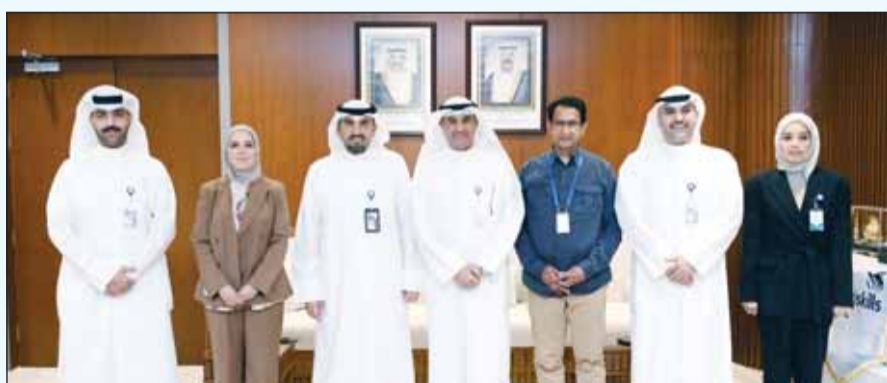
لقطة تذكارية عقب الإعلان عن الشراكة بين "وياي" و "التعليم التطبيقي والتدريب"

أعلن بنك وياي، أول بنك رقمي في الكويت، عن شراكته الاستراتيجية مع الهيئة العامة للتعليم التطبيقي والتدريب، وذلك في إطار تعزيز التعاون المشترك لدعم الطلبة المستجدين من فريقي المرحلة الثانوية من خلال حملة "بدايتي صح"، ومواجهة رحلتهم الأكاديمية منذ بداية التحاقهم بالكلية والمعاهد التابعة للهيئة.