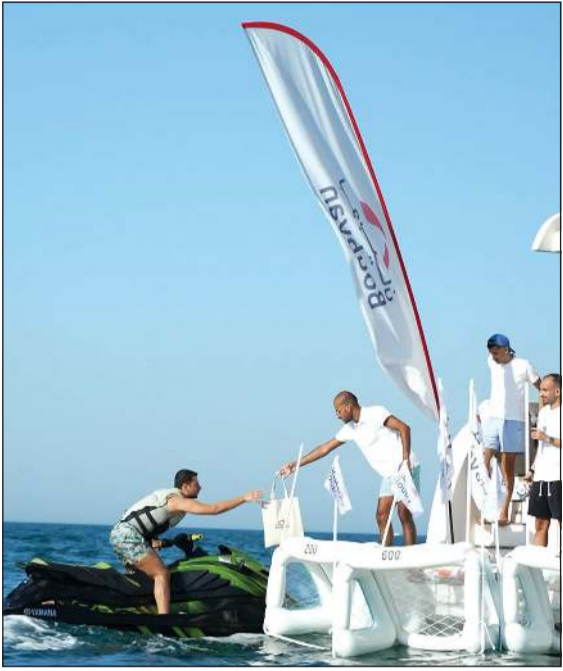
جانب من الفعالية وتوزيع الهدايا