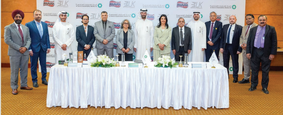
المشاركون في حفل توقيع الشراكة