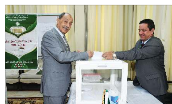
سفير الجزائر عمر بلعاج خلال عملية الاقتراع

على أداء واجبه الوطني والإسهام في هذا الاستحقاق الدستوري. وأوضح أن السفارة تتبع سير العملية الانتخابية بشكل مستمر، حيث يتم إرسال نسب المشاركة إلى الجهات المختصة في الجزائر 3 مرات يومياً عبر النظام الإلكتروني، فيما تبدأ عملية فرز الأصوات عقب إغلاق صناديق الاقتراع بحضور أعضاء مكتب التصويت