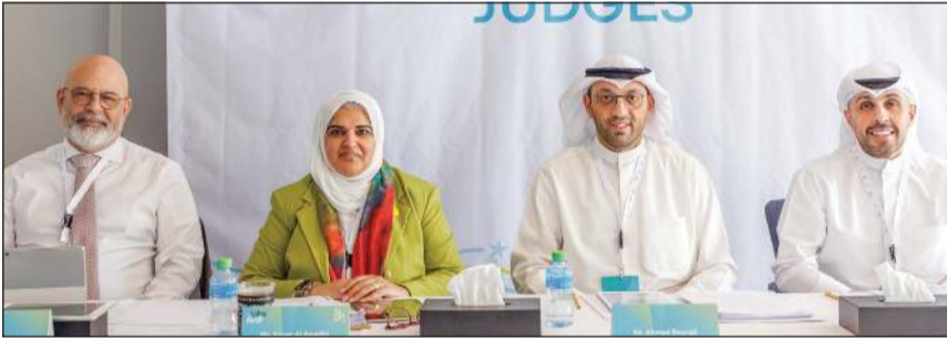
لجنة تحكيم مسابقة برنامج الشركة

الأعمال، وتسعى إلى سد الفجوة بين مخرجات التعليم واحتياجات سوق العمل من خلال برامج تدريبية وإرشادية عملية يقدمها نخبة من قادة الأعمال ورواد الأعمال المتطوعين. يذكر أن شركة علي عبد الوهاب المطوع التجارية هي واحدة من أكبر الشركات التجارية في الكويت، تعمل في قطاعات متنوعة وتمثل أكثر من 100 علامة تجارية عالمية في السوق المحلي في مجالي الجملة والتجزئة.