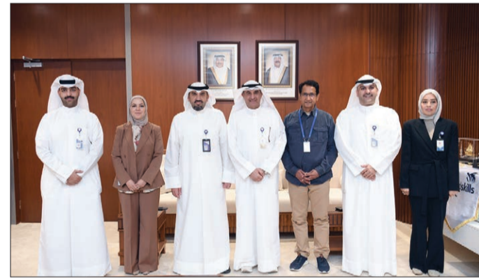
لقطة جماعية عقب الإعلان عن الشراكة

أعلن بنك وياي، أول بنك رقمي في الكويت، عن شراكته الإستراتيجية مع الهيئة العامة للتعليم التطبيقي والتدريب، وذلك في إطار تعزيز التعاون المشترك لدعم الطلبة المستجدين من خريجي المرحلة الثانوية من خلال حملة «بدايتي صح»، ومواكبة رحلتهم الأكاديمية منذ بداية التحاقهم بالكلية والمعاهد التابعة للهيئة.