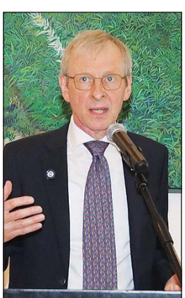
سفير بلجيكا كريستيان دومن محمداً (محمد هاشم)

وكشف أن من أولوياته العمل على إطلاق رحلات جوية مباشرة بين الكويت وبلجيكا، موضحاً أن عدم وجود خط مباشر يشكل أحد أبرز العوائق أمام زيادة أعداد السياح الكويتيين، كما يصعب تحديد الأرقام الفعلية للمسافرين القادمين من الكويت عبر رحلات غير مباشرة، مشيراً إلى أن المرحلة المقبلة ستشهد استضافة ممثلين عن شركات وكالات السفر البلجيكية في الكويت للتعريف بالفرص السياحية التي توفرها بلجيكا، معرباً عن ثقته بأن هذه الخطوة