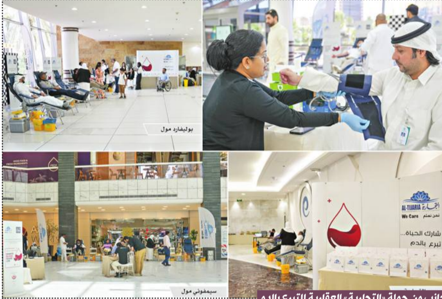
جانب من حملة «التجارية» العقارية للتبرع بالدم

خلال هذه الحملة إلى تشجيع أفراد المجتمع على المساهمة في إنقاذ الأرواح، وتعزيز ثقافة الطوع والتكافل المجتمعي، بما ينسجم مع قيم الشركة ورؤيتها في تحقيق أثر إيجابي ومستدام. وأضاف أن الشركة تحرص على إطلاق وتنفيذ مبادرات مجتمعية متنوعة على مدار العام في مجالات الصحة والتعليم والاستدامة، إيماناً منها بأهمية دور القطاع الخاص كشريك أساسي في دعم التنمية المجتمعية وتحقيق أهداف التنمية المستدامة.