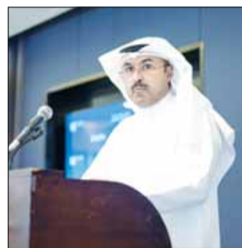
جانب من كلمة المحيلان

البنية الرقمية للمشاريع العمرانية الكبرى، بما يضمن جاهزيتها للتعامل مع متطلبات الاقتصاد الرقمي في المستقبل، ويعزز من تنافسية الكويت كمركز حضري متقدم في المنطقة.