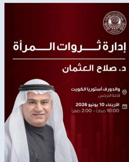
د. صلاح العثمان

وعلى مدى أكثر من خمسة عقود، لعب معهد الدراسات المصرفية دوراً محورياً في تطوير الكفاءات، وتعزيز القدرات المهنية في القطاعين المصرفي والمالي في الكويت، من خلال برامج التدريب المتخصصة، والتعليم التنفيذي، والشهادات المهنية، والتقييمات، والتعلم الإلكتروني، والمبادرات البحثية.