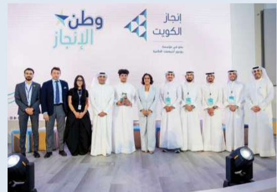
صورة جماعية على هامش الفعالية