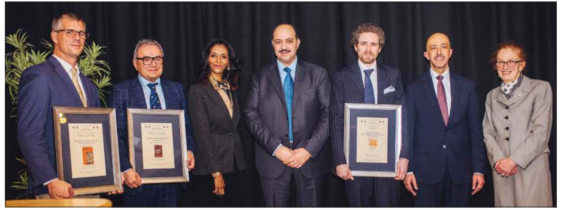
الشيخ مبارك العبدالله والسفير بدر المنيع مع الفائزين الثلاثة