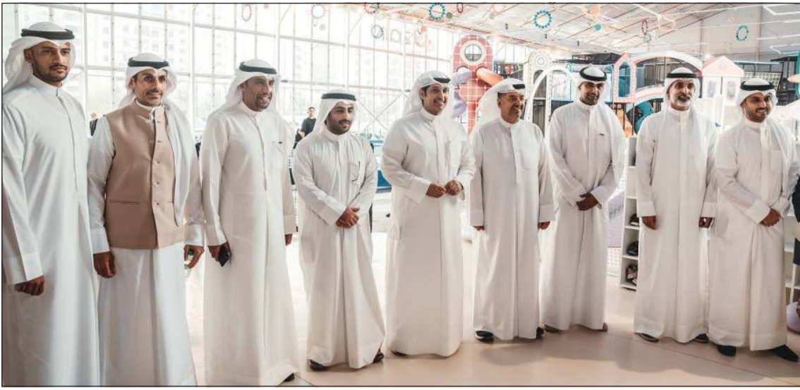
وزير الإعلام والثقافة ووزير الدولة لشؤون الشباب عبدالرحمن المطيري متوسلا الشيخ محمد سلمان وأنور الحليبة ووليد الخشتي وفهد البغلي