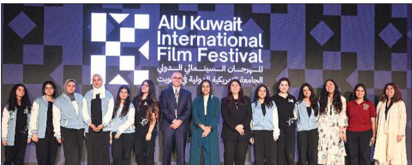
صورة جماعية للمشاركين في فعاليات اليوم الخامس للمهرجان

وأن إقامة فعاليات فنية داخل الجامعات أمر بالغ الأهمية لخلق جيل جديد يملك شغف السينما وثقافتها.