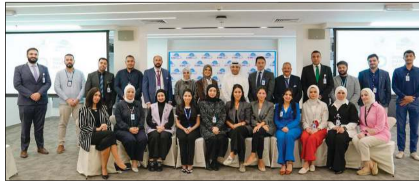
صورة جماعية للمشاركين في المحاضرة التوعوية

وتمكن موظفيها من بيئة عمل أكثر وعياً واهتماماً بالصحة والالتصال لتنظيم مثل هذه المحاضرات التوعوية والتثقيفية لرفع الوعي الصحي في الشركة. وأكد غضنفري أن تنظيم هذه الفعالية يندرج ضمن استراتيجية الشركة الرامية إلى دعم مبادرات الصحة العامة