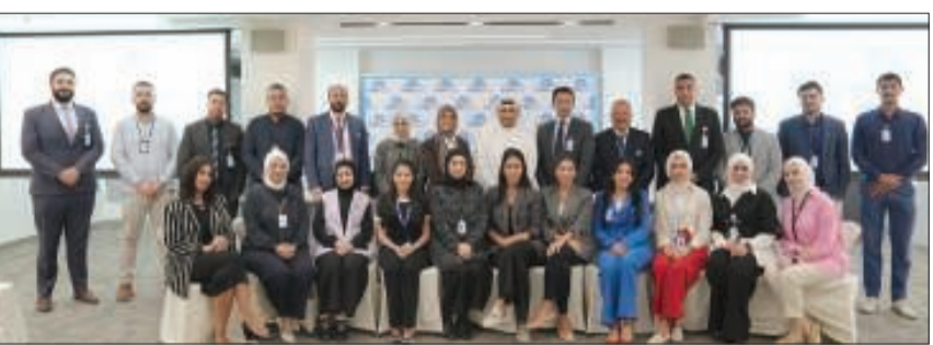
المشاركين في المحاضرة التوعوية

لتنظيم مثل هذه المحاضرات التوعوية والتثقيفية، لرفع الوعي الصحي في الشركة. وأكد عُضنغري، أن تنظيم الفعالية يندرج ضمن إستراتيجية الشركة الرامية إلى دعم مبادرات الصحة العامة وتمكين موظفيها من بيئة عمل أكثر وعياً وإهتماماً بالصحة الجسدية والنفسية، تجسيدا لالتزامها بمبادئ البيئة والمجتمع والحوكمة (ESG) وترسيخاً لقيمتها المؤسسية تحت شعار «نحن نهتم»، الذي يعكس التزامها بتعزيز جودة الحياة وتطبيق الممارسات المسؤولة والمستدامة.