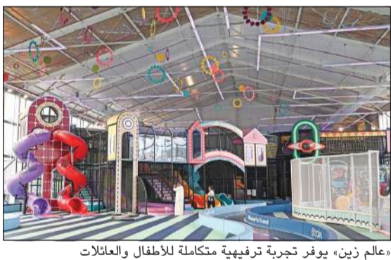
«عالم زين» يوفر تجربة ترفيهية متكاملة للأطفال والعائلات

مشاركة عدد من العلامات التجارية الشبابية الوطنية، إلى جانب جلسات خارجية مطلة على البحر، بما يوفر تجربة ترفيهية متكاملة للأفراد والعائلات في أجواء شتوية مميزة.