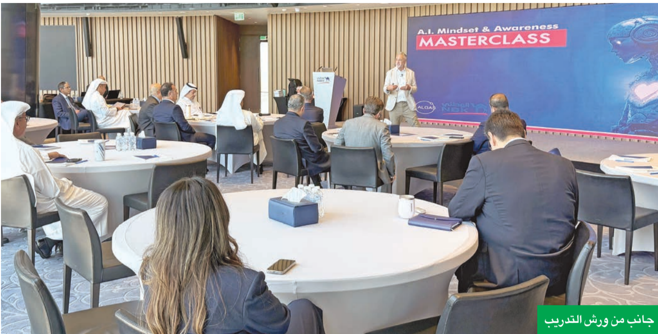
جانب من ورش التدريب

تشارك فيها القيادات التنفيذية وتركز على أحدث التطورات والتقنيات