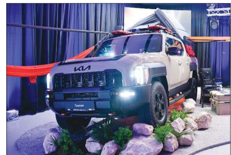
كيا تاسمان الجديد