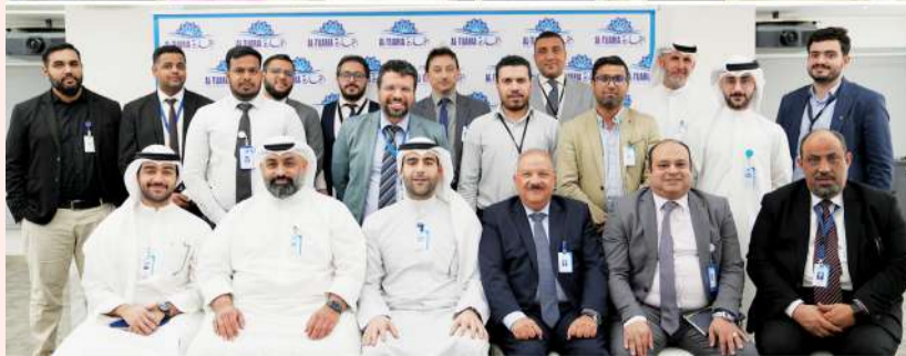
موظفو وموظفات الشركة المشاركون في الدورة التدريبية