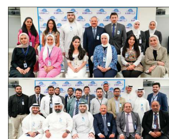
صورة جماعية للمشاركين في دورة «حوكمة الشركات»

التي تتميز بمتانة الطلب وقيمة عالية، مما يجعلها خياراً جذاباً للمستثمرين الباحثين عن فرص استثمارية طويلة الأجل. وتعد هذه الشراكة خطوة مهمة في تعزيز التزامنا بالشفافية والمعاملة العادلة والشفافية والمعاملة