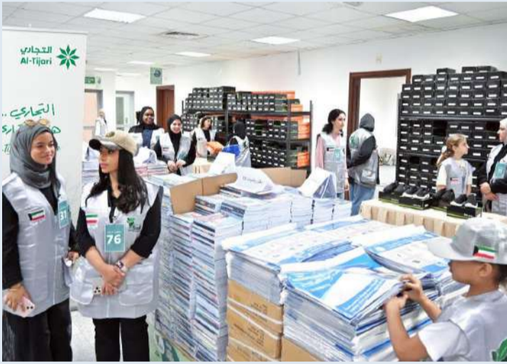
إقبال لافت على المعرض

في تخفيف الأعباء عن الأسر المتعففة، وتمنح إبناءهم فرصة الاستعداد الأمثل للعام الدراسي».