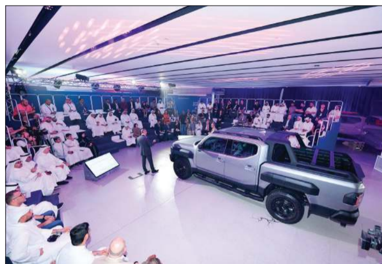
جانب من العرض