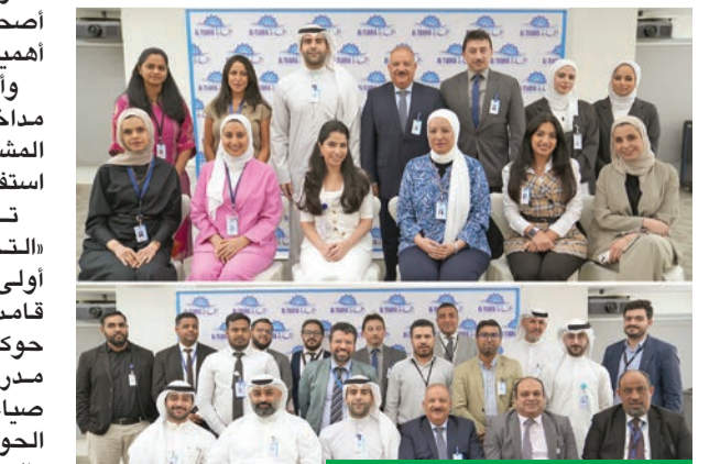
المشاركون في الدورة التدريبية

الاجتماعي، وتعزيز النزاهة. كما تسعى إلى خلق التوازن وتنظيم وحماية العلاقات بين أصحاب المصالح ومجلس الإدارة والإدارة التنفيذية والمساهمين. وتم استعراض ملخص لجميع قواعد الحوكمة الأحد عشر، ومناقشة الأدوار والمسؤوليات الرئيسية لمجلس الإدارة واللجان المنتبذة عنه والإدارة التنفيذية والرقابية، وأهمية تعزيز السلوك المهني والقيم الأخلاقية والإفصاح والشفافية بشكل دقيق وفي الوقت المناسب، واحترام حقوق المساهمين وإدراك دور أصحاب المصالح والتركيبن على أهمية المسؤولية الاجتماعية. وأفسحت الدورة المجال أمام مداخلات واستفسارات وأسئلة المشاركين والحضور، لضمان استفادتهم القصوى منها. وتجدر الإشارة إلى أن «التجارية العقارية» تُعد من أولى الشركات في الكويت التي قامت بتبني وتطبيق مفهوم حوكمة الشركات وفق منهجية مدروسة وشاملة، من خلال صياغة وتطبيق دليل وسياسات الحوكمة، وفقاً لأفضل المعايير والممارسات العالمية في هذا المجال.