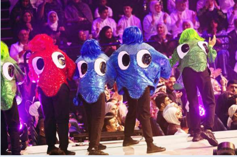
عروض «ميامي شو 3.0»