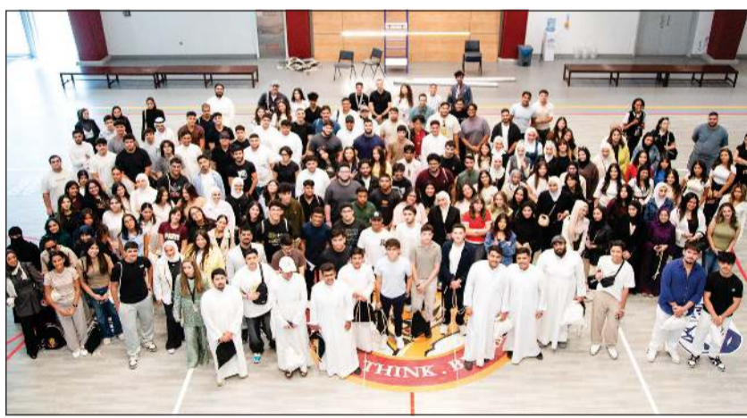
صورة جماعية للطلبة المستجدين لعام 2026

استقبلت الجامعة الأمريكية في الكويت AUK رسمياً طلبتها الجدد للعام الأكاديمي 2025-2026 من خلال برنامج إرشادي صمم للتعريف بقيم الجامعة ورسالتها ومجتمعها، بوصفها الجامعة الوحيدة في الكويت التي تعتمد نموذج العلوم الإنسانية والآداب الحرة. وتضمن البرنامج كلمات ملهمة ألقتها رئيسة الجامعة د.دروضة عواد، ونائب رئيس الجامعة لشؤون الطلبة د.عبدالرحمن الفرخان، حيث أكد التزام الجامعة بالتميز الأكاديمي، وتنمية الطلبة، وإعدادهم لخوض رحلة جامعية غنية بالفرص والإنجازات. وفي كلمتها، شددت د.دروضة عواد على أهمية رسالة العلوم الإنسانية والآداب الحرة التي تتبناها AUK، والدور الفريد الذي تؤديه الجامعة في إعداد قادة المستقبل داخل الكويت وخارجها.