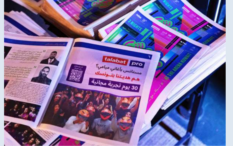
عرض خاص من «طلبات» لفرقة ميامي

التي دعمت العرض والبث المباشر بصفتها الشريك الاستراتيجي الرئيسي. «طلبات» تؤكد التزامها الدائم بتقديم أسلوب حياة متكامل، يلبي احتياجات المجتمع اليومية، من الأغذية والمواد الاستهلاكية إلى التجارب الفنية والترفيهية عند الطلب، مع دعمها المستمر للمواهب والأعمال المحلية، التي تجسد روح الكويت الأصيلة.