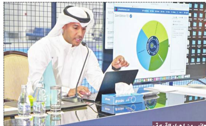
جانب من إجراء القرعة