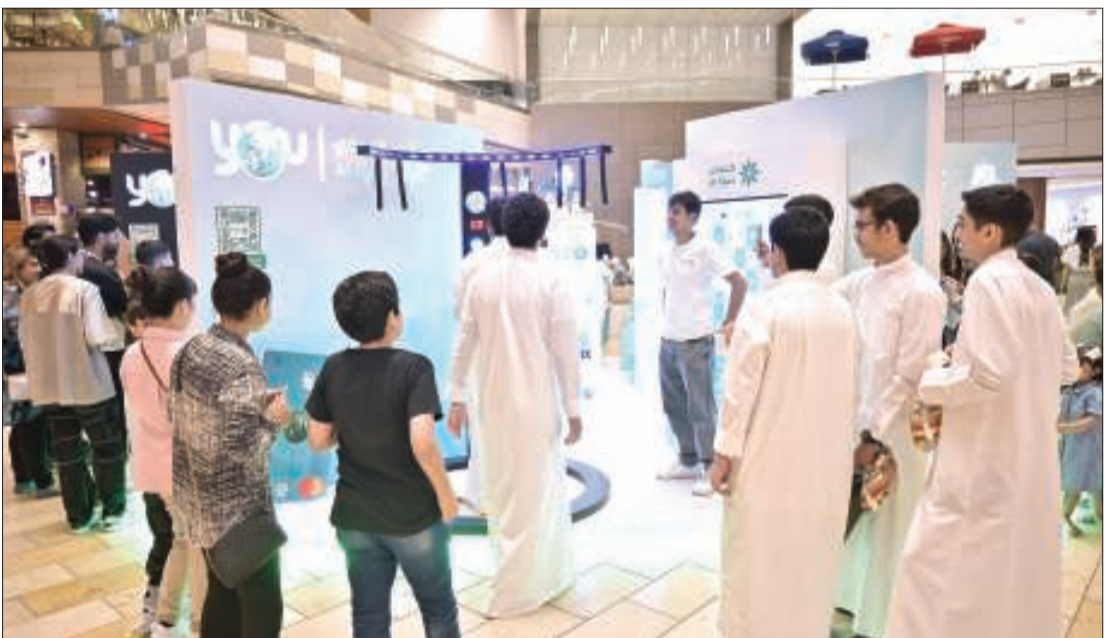
شباب في جناح «التجاري» بمجمع الأفيون