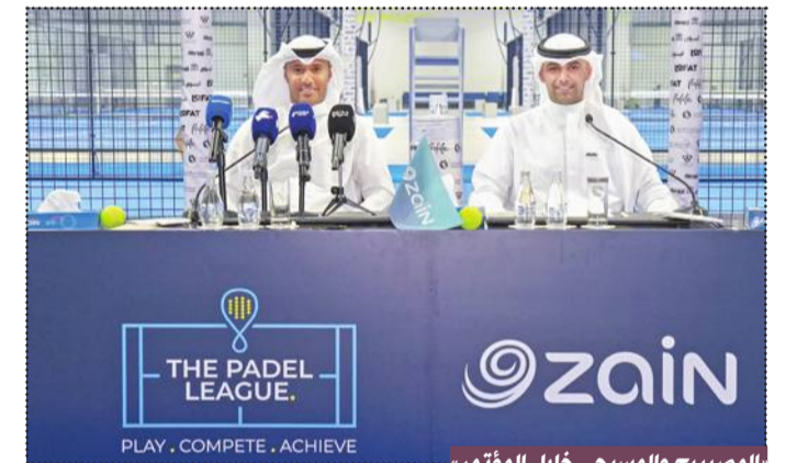
المصيبيح والمسبحي خلال المؤتمر

وتتوزع منافسات نسخة زين على مدار 10 أيام، تشمل ثلاث فئات رئيسية هي تحت 16 عاماً والرجال والسيدات، مع فتح باب المشاركة أمام جميع لاعبي دول مجلس التعاون الخليجي ورصد جوائز قيمة لكل فئة. وتحت رعاية زين لهذا الحدث الرياضي المتميز التزامها بدعم الرياضات الصاعدة مثل البادل، وحرصها على أن تكون جزءاً من المبادرات التي تمكن الرياضيين من استعراض مواهبهم، وتمنحهم الفرصة للتألق في الساحات الدولية. وتأتي هذه الرعاية استمراراً لدعم زين المتواصل لرياضة البادل، والتي باتت من أكثر الرياضات رواجاً بين فئة الشباب في الكويت والمنطقة، حيث حرصت الشركة خلال السنوات الماضية على دعم بطولات محلية وإقليمية كبرى، وتنظيم فعاليات داخلية لموظفيها بهدف ترسيخ ثقافة النشاط البدني والتشجيع على أسلوب حياة صحي.