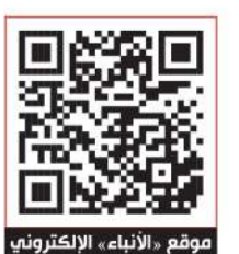
موقع «الأنباء» الإلكتروني