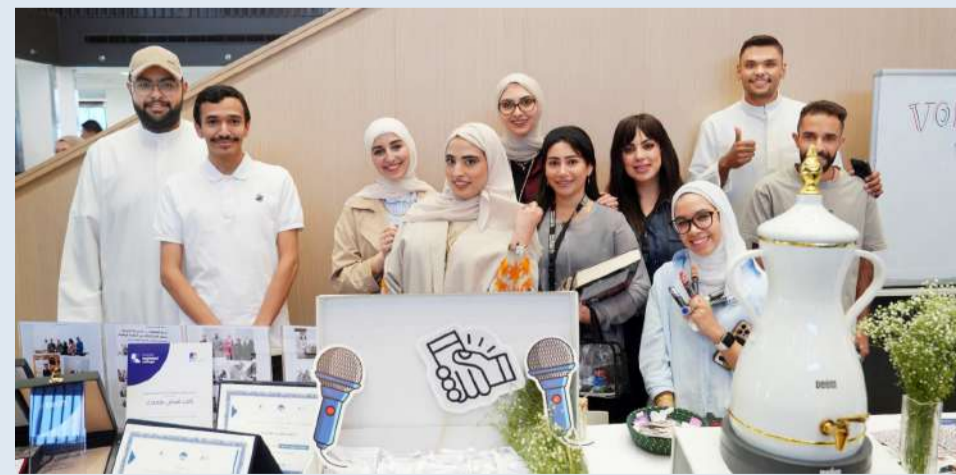
جانب من الأنشطة الطلابية

المختلفة، ومقابلة الأعضاء الحاليين، واختيار النادي المناسب لمهاراتهم وشغفهم، بينما يمكن للأعضاء الحاليين مشاركة نجاحاتهم، وإلهام الآخرين، والمساهمة في نمو مجتمعاتهم. أصبحت هذه الفعالية جزءاً مهماً من الحياة الطلابية في AIU، حيث تشجع الطلاب على الانخراط في الأنشطة الجامعية، واكتشاف مجالات جديدة، وبناء علاقات قيمة خارج الفصول الدراسية. وتواصل الجامعة التزامها بتوفير الفرص، التي تدعم نمو الطلاب، وإبداعهم، وتعاونهم.