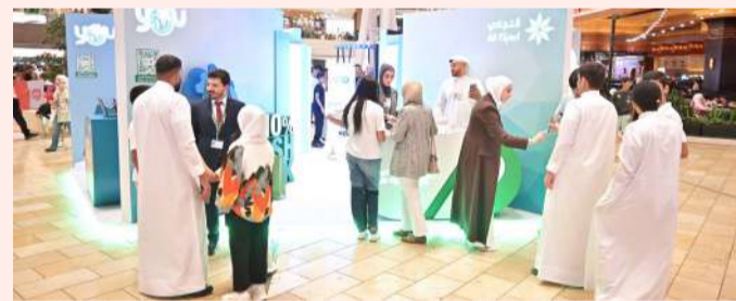
إقبال على جناح البنك التجاري في الأفيوز

سينما، وكاريسو كافيه، حيث اجتمع جميع الشركاء في جناح واحد، حيث تم تقديم تجربة تفاعلية مبتكرة جمعت بين الخدمات المصرفية الذكية والعروض