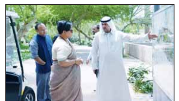
Indian envoy visits botanical facilities.

This visit comes as part of strengthening communication with diplomatic and community entities and highlighting the diverse facilities and experiences offered by Boulevard Park.