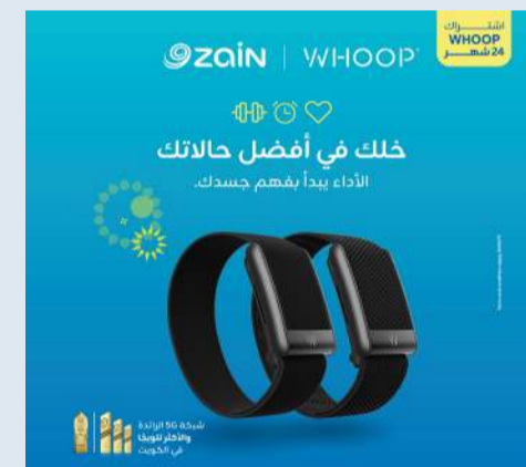
جهاز WHOOP مع اشتراك في العضوية لمدة 24 شهراً ابتداءً من 3.19 د.ك شهرياً

أما عضوية WHOOP Peak، فتقدم تجربة أعمق من خلال نبضات القلب أثناء الراحة، ودورات النوم، وتوفر WHOOP رؤى شخصية تساعد عملاء زين على التدريب بذكاء، والتعافي بشكل أفضل، وإدارة التوتر، وبدء يومهم باستعداد أكبر. ويُعزز هذا التعاون دور زين في تمكين الحياة الرقمية،