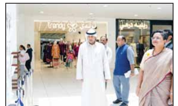
Indian envoy visits entertainment areas.