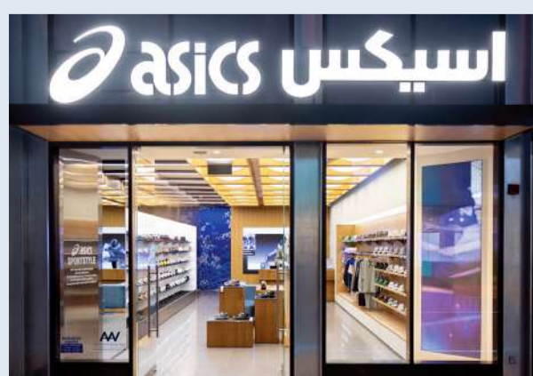
محل أسيكس سبورت ستايل في مجمع الأفتنيوز