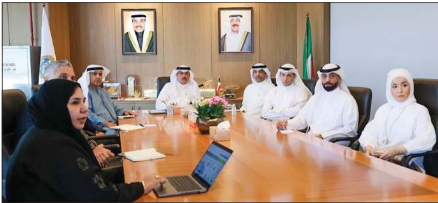
وزير التربية م.سيد جلال الطيطباتي والسفير الإماراتي مطر النيادي والوفد المرافق له

جاء ذلك خلال استقباله سفيرة دولة الإمارات العربية المتحدة الشقيقة لدى الكويت د.مطر النيادي، برفقة وفد من القطاع الخاص الإماراتي المخصص في إحدى المنصات الرقمية التعليمية، وذلك بحضور عدد من القيادات التربوية والمسؤولين في وزارة التربية. وشهد اللقاء تقديم عرض تعريف حول المنصة الرقمية وما توفره من خدمات وحلول تقنية حديثة تدعم العملية التعليمية، إلى جانب استعراض أبرز التجارب والممارسات في مجال التحول الرقمي وتوظيف التكنولوجيا في التعليم. وأكد الجانبان خلال اللقاء أهمية تعزيز التعاون والتجارب الناجحة في المجالات التعليمية والتقنية، بما يساهم في دعم جهود تطوير المنظومة التعليمية وقطاع التعليم وبناء القدرات وتطوير المبادرات النوعية الداعمة للتعليم الحديث.