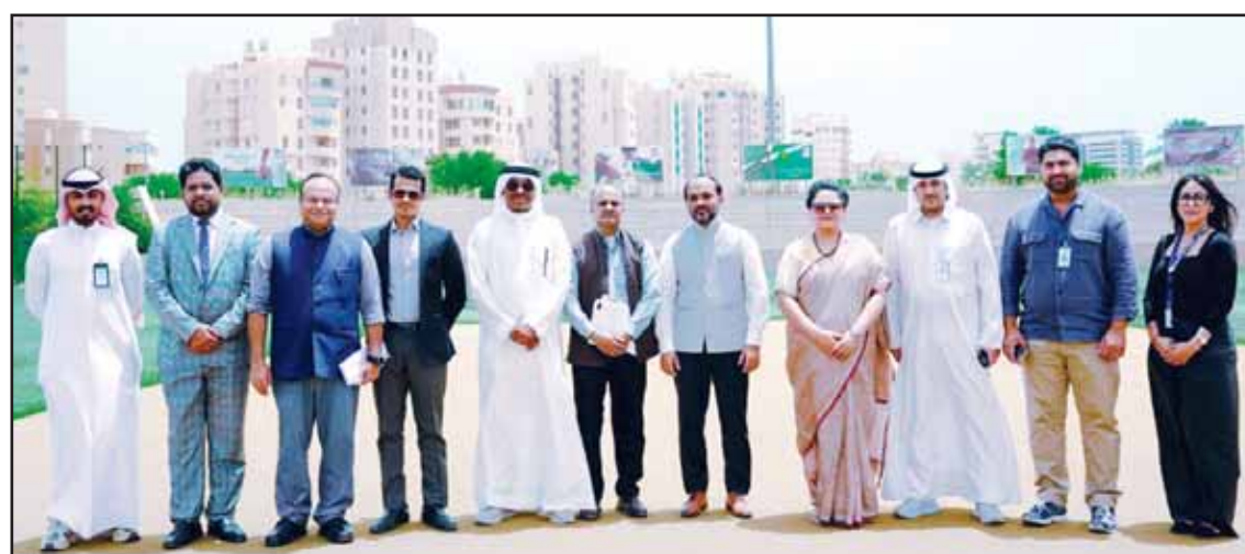
Indian diplomatic delegation tours park's cricket field.