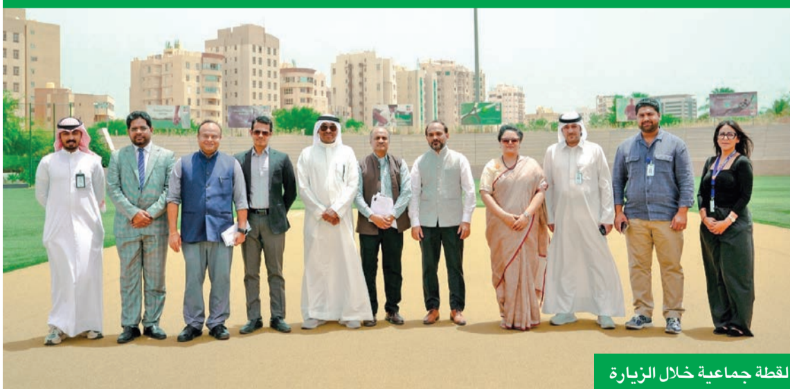
لقطة جماعية خلال الزيارة

متنوعة التي يتمتع بها منتزه بوليفارد، مشيدة بالأجواء العائلية والطبيعة المنعزة وجهة مميزة للزوار في الكويت. وناتى هذه الزيارة في إطار تعزيز التواصل مع مختلف الجهات الدبلوماسية والمجتمعية، والتعريف بالمرافق المتنوعة التي يتميز بها منتزه بوليفارد.