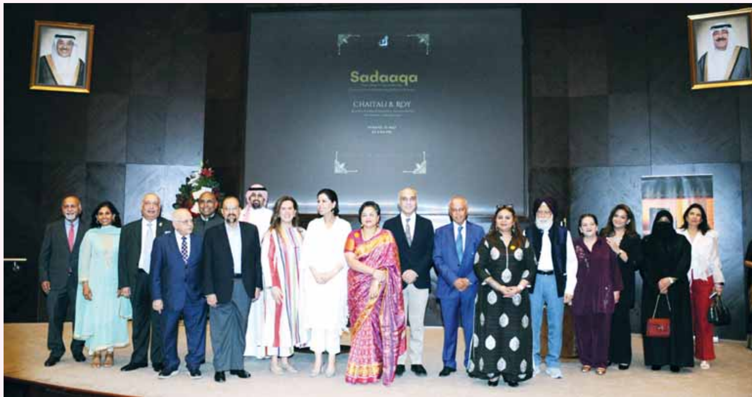
Cultural figures and diplomats gather at Kuwait National Library for official launch.

diplomatic community. Also present were leading Kuwaiti cultural personalities and several of the individuals featured in the book.