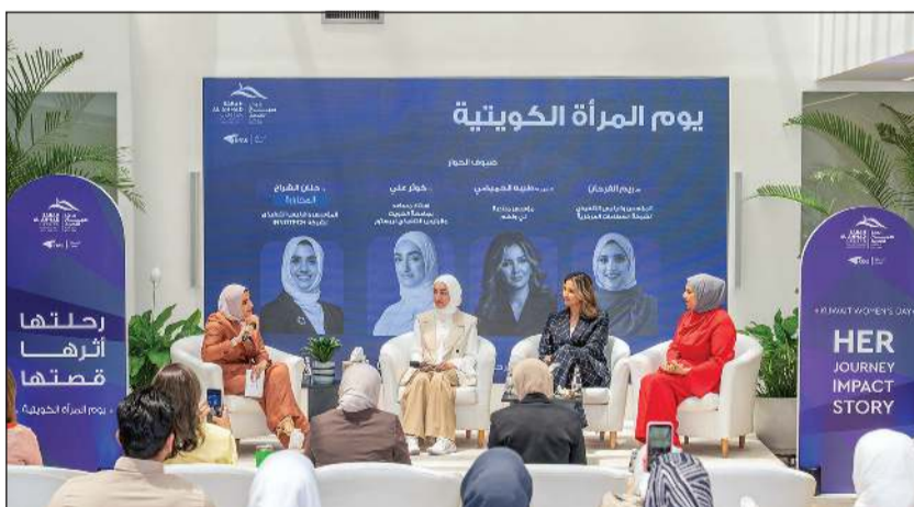
المشاركات في الجلسة الحوارية

والتحدي الذي ساهمت في تشكيل مسيرتهن في مجالات الابتكار وريادة الأعمال والقيادة، كما ناقشن أهمية بناء بيئة داعمة للمرأة وتمكينها من صناعة أثر إيجابي ومستدام في المجتمع. وشهدت الجلسة تفاعلاً من الحضور خلال فترة الأسئلة