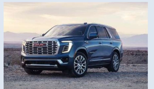
جي ام سي يوكون دينالي