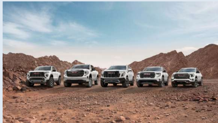
مجموعة من موديلات GMC الجديدة

للاستفادة مجاناً من تظليل حراري وحماية كاملة على «يوكون» و«سييرا»، بينما يُضفي «يوكون دينالي» لهذا الصيانة لمدة 5 سنوات/ مسافة 100000 كلم، فيما يتراقف «سييرا» مع عقد صيانة لمدة سنة/ مسافة 30000 كلم. من المفترض أن تسري حملة مبيعات التجزئة لمدة شهر أو لحين نفاذ الكمية، وتشجع «جي إم سي بهبهاني» العملاء على التواصل أو زيارة الموقع الإلكتروني gmcbهبهاني.com للحصول على التفاصيل الكاملة، والتعريف على الشروط والأحكام.