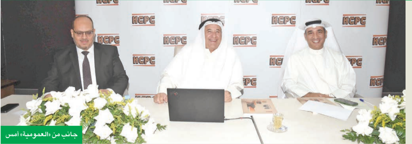
جانب من «العمومية» أمس