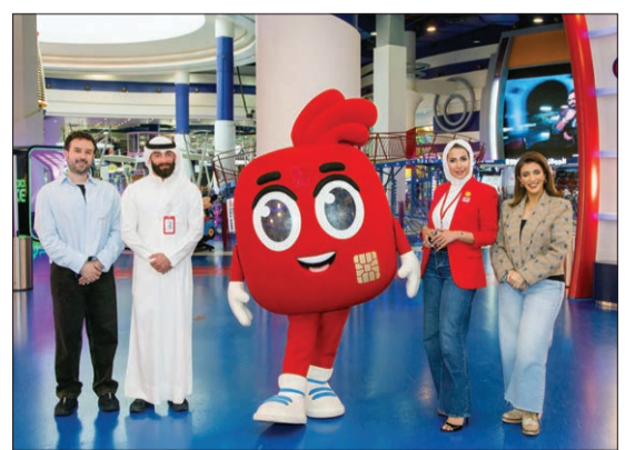
صور جماعية لفريق «الخليج»

والإدارة المسؤولة للاموال. كما تم تعريف الأطفال بأساسيات التعامل مع المال بطريقة مبسطة ومناسبة لأعمارهم، بما يساعدهم على بناء علاقة صحية مع مفهوم الادخار والإنفاق. وذلك إلى جانب