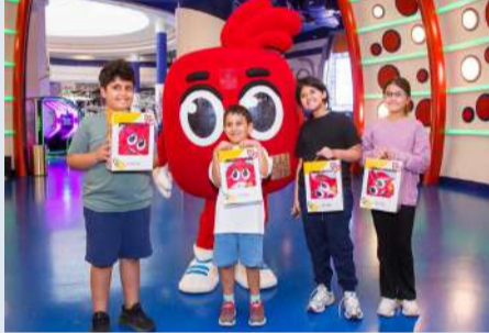
جانب من فعاليات البرنامج

في إطار جهوده المستمرة لمكافحة عملائه، وتعزيز الوعي المالي لدى الأجيال الناشئة، نظم بنك الخليج يوماً ترفيهياً مميزاً للأطفال من عملاء حساب neo، وذلك بالتعاون مع مركز Funtiki، أحد أكبر المراكز الترفيهية في الكويت. وقد شهدت الفعالية إقبالاً واسعاً من الأطفال وأولياء أمورهم، الذين شاركوا في مجموعة متنوعة من الأنشطة التعليمية والترفيهية المصممة خصيصاً لغرس قيم الادخار والتوفير لدى الناشء، إلى جانب فرصة التعرف على الخدمات المصرفية المميزة، التي يوفرها البنك لعملاء حساب neo من الأطفال. وسلط فريق بنك الخليج خلال الفعالية الضوء على أهمية الادخار والتخطيط المالي والإدارة المسؤولة للأموال، كما تم تعريف الأطفال بأساسيات التعامل مع المال بطريقة مبسطة ومناسبة لأعمارهم، بما يساعدهم على بناء علاقة صحية مع مفهوم الادخار والإنفاق. وذلك إلى جانب التوعية بأهداف حملة «لنكن على دراية»، وأهمية الحفاظ على البيانات المصرفية وحمايتها من محاولات الاحتيال. ويمثل حساب neo للأطفال من بنك الخليج إحدى أبرز الخدمات المصرفية المخصصة للأطفال، حيث يوفر لأولياء وسيلة آمنة وسهلة لبناء المستقبل المالي لأطفالهم، كما أن الحساب مصمم ليناسب جميع