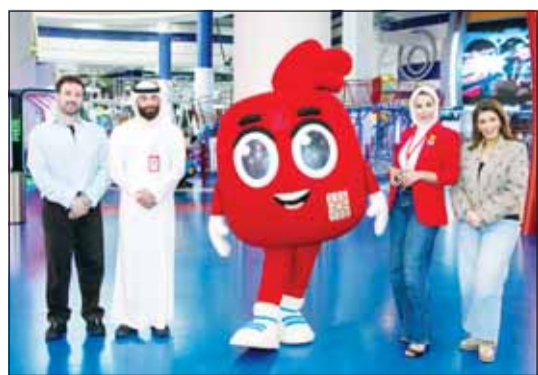
فريق بنك الخليج

نظم بنك الخليج يوماً ترفيهياً مميزاً للأطفال من عملاء حساب neo، وذلك بالتعاون مع مركز FunTiki. أحد أكبر المراكز الترفيهية في الكويت. وقد شهدت الفعالية إقبالاً واسعاً من الأطفال وأولياء أمورهم، الذين شاركوا في مجموعة متنوعة من الأنشطة التعليمية والترفيهية المصممة خصيصاً لفهم قيم الادخار والتوفير لدى النشء، إلى جانب فرصة التعرف على الخدمات المصرفية المميزة التي يوفرها البنك لعملاء حساب neo من الأطفال.