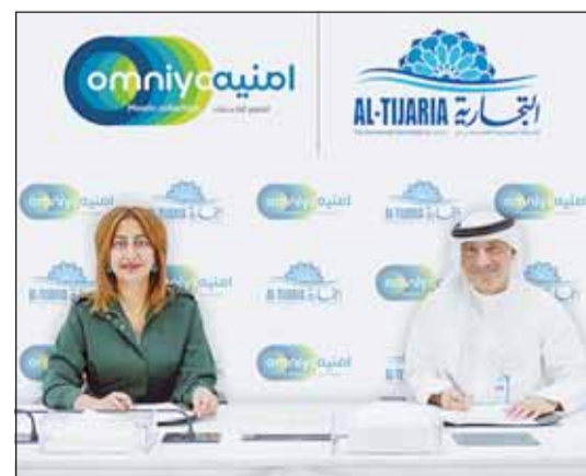
خلال توقيع اتفاقية الشراكة

ويمثل حساب neo للأطفال من بنك الخليج إحدى أبرز الخدمات المصرفية المخصصة للأطفال، حيث يوفر لأبناء وسيلة آمنة وسهلة لبناء المستقبل المالي لأطفالهم. كما أن الحساب مصمم ليناسب جميع الأطفال حتى بلوغهم سن الرابعة عشرة، ويمكن فتحه بسهولة عبر جميع فروع البنك دون الحاجة إلى حد أدنى للرصيد أو رسوم إضافية. ومن خلال هذا الحساب، يتعلم الأطفال قيمة الادخار