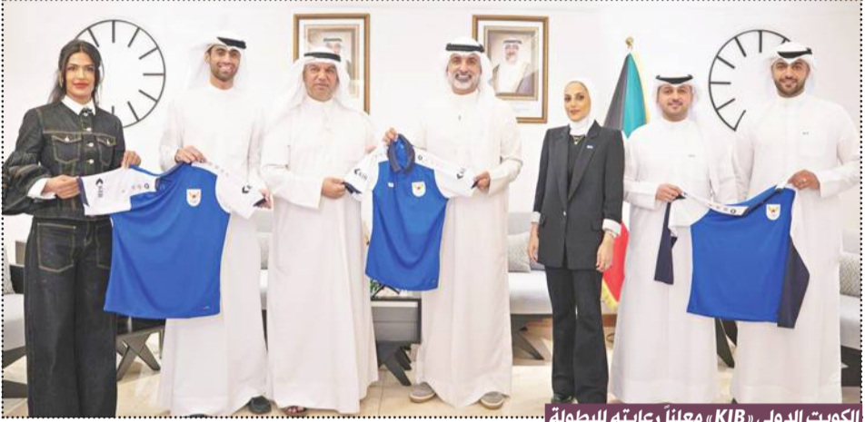
الكويت الدولي «KIB» معلناً رعايته للبطولة

في توطيد العلاقات الأخوية بين الشعوب الخليجية، وفتح آفاق أوسع للتعاون الرياضي المشترك. وفي هذا الإطار، تمثل مشاركة دولة الكويت في هذه الدورة امتداداً لحضورها الرياضي في الدورات السابقة، وفرصة لتعزيز مكانتها ضمن المشهد الرياضي الخليجي، من خلال المنافسة في مجموعة متنوعة من الألعاب التي تعكس تنوع القاعدة الرياضية الوطنية. وتشهد الدورة مشاركة نحو 200 لاعب ولاعبة، يتنافسون في 16 رياضة مختلفة، تشمل: الإسكواش، والعباقرة، وكرة الطاولة، والبولينغ، والكاراتي، وكرة الطائرة، والقفز، والسهم، والرمي، والبياردو، والسنوكر، والسباحة، والتايكوندو، وكرة السلة (3x3)، والفروسية، والمبارزة، وكرة اليد، والبادمinton. ويكسر هذا التنوع حجم التطور الذي تشهده الرياضة الكويتية على مستوى الألعاب الفردية والجماعية. ومن هذا المنطلق، تسهم الرعاية التي يقدمها «KIB» في دعم جاهزية الرياضيين وتوفير بيئة مناسبة لتتبع لهم التركيز على الأداء والمنافسة، بعيداً عن التحديات المرتبطة بالجوانب اللوجستية، وهو ما يشكل عاملاً مهماً في تحسين جودة المشاركة ورفع مستوى النتائج.