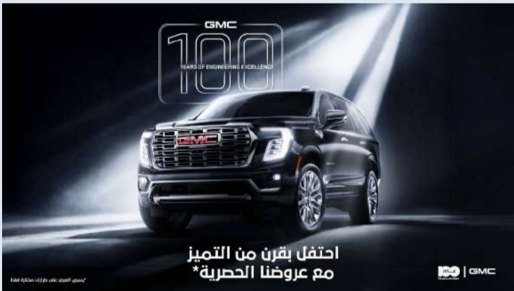
ملصق العروض بمناسبة الذكرى المئوية الأولى

للاستفادة مجاناً من تظليل حراري وحماية كاملة على «يوكون» و«سييرا»، بينما يُضفي «يوكون دينالي» لهذا الصيانة لمدة 5 سنوات/ مسافة 100000 كلم، فيما يتراقف «سييرا» مع عقد صيانة لمدة سنة/ مسافة 30000 كلم. من المفترض أن تسري حملة مبيعات التجزئة لمدة شهر أو لحين نفاذ الكمية، وتشجع «جي إم سي بهبهاني» العملاء على التواصل أو زيارة الموقع الإلكتروني gmcbهبهاني.com للحصول على التفاصيل الكاملة، والتعريف على الشروط والأحكام.