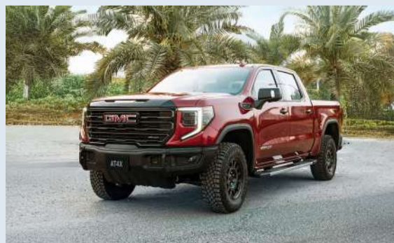
جي ام سي AT4X