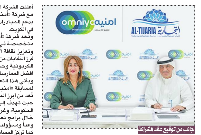
جانب من توقيع عقد الشراكة

أعلنت الشركة التجارية العقارية عن إبرام شراكة سنوية مع شركة «أمنية»، في خطوة تعكس التزامها المستمر بدعم المبادرات البيئية وتعزيز المسؤولية المجتمعية في الكويت. وتعد شركة «أمنية» شركة كويتية غير هادفة للربح، متخصصة في تطوير حلول مبتكرة لإدارة النفايات وتعزيز ثقافة البيئة، حيث تسعى إلى ترسيخ سلوك فرز النفايات من المصدر، والمساهمة في تقليل الانبعاثات الكربونية وحماية الموارد الطبيعية، بما يتماشى مع أفضل الممارسات والمعايير البيئية. ويأتي هذا التعاون من خلال رعاية «التجارية العقارية» «أمنية مدرستك» في نسختها الرابعة، والتي تعد من أبرز المبادرات البيئية على مستوى دولة الكويت، حيث تهدف إلى نشر الوعي البيئي لدى طلبة المدارس الحكومية، وغرس مفاهيم الاستدامة وإعادة التدوير من خلال برامج تعليمية وتطبيقية تسهم في بناء جيل أكثر وعياً ومسؤولية تجاه البيئة. كما تركز المسابقة على إشراك مختلف المراحل التعليمية،