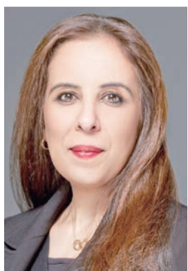
نوف مساعد المشعان

توفير حلول رقمية ومنصات تسويقية تساهم في تعزيز حضور المشاريع لدعم المبادرين