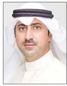
الشيخ د.نمر الصباح

المتغيرات الإقليمية والدولية في ضوء صدور قرار «أسواق المال».. ونعد خطوة محورية بمسيرة تطوير البيئة الاستثمارية