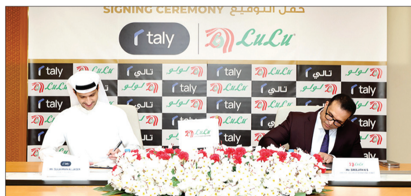
كولتارا والجاسر خلال توقيع الشراكة

ذلك المواد الغذائية، في المستقبل القريب. ويتمثل هدفنا في مواصلة توسيع شراكاتنا، وتمكين المزيد من العملاء من الوصول إلى خيارات دفع مرحة وشافة وخالية من الفوائد عبر مشترياتهم اليومية». وتتوافق الشراكة مع الإستراتيجية الأوسع لـ «تالي» الرامية إلى التعاون مع كبار التجار وتجار التجزئة، بما يتيح للعملاء التسوق بمرونة أكبر، مع دعم التجار في تعزيز تجربة العملاء وتحقيق النمو.